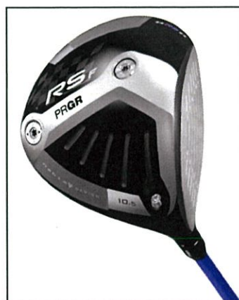
対象モデル(現行品)